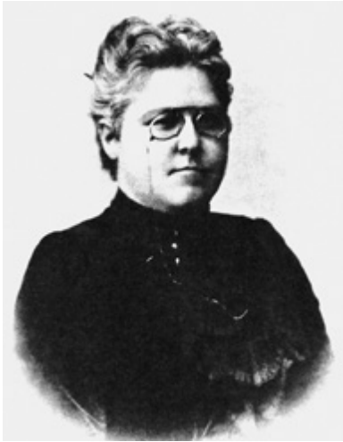
Abbildung 4: Minna Kautsky um 1884