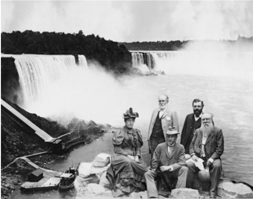
Abbildung 6: Gruppenbild: Olga Wisinger-Florian vor Niagarafälle, 1893 (Giese & Schweiger, Wien)

Sitzungen recht ungemütlich, „der Strike spitzt sich unangenehm zu“ 380 ; zudem war ein bereits vereinbarter Termin eines »Geselligen Abends« kurzerhand abgesagt worden und hatte zu einiger Verwirrung unter den Besuchern beigetragen. 381