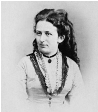
Abbildung 15: Max von Weißenthurn (ÖNB)

den Frauenrechtler/innen, mit anmaßenden und ungebührlichen Forderungen die Unzufriedenheit der Frauen zu fördern, und beschwört das Ideal der sittlich hochstehenden, opferbereiten Liebe, mit der jede Frau an dem ihr zugewiesenen Platz wirken sollte. Darüber hinaus schrieb sie zum Gelderwerb Novellen und Romane aus dem Fach „Herz und Schmerz“.