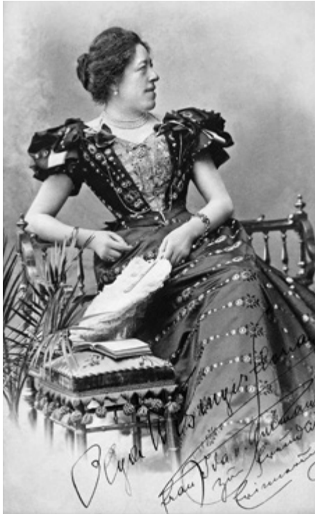
Abbildung 19: Olga Wisinger-Florian

erhielt das Mädchen seine erste Malausbildung. Damit hatten sie der Begabung und dem Wunsch der Tochter entsprochen, „[...] hoffte Olga ja auf diesem Wege sich einen selbständigen Lebenserwerb verschaffen zu können.“ 503