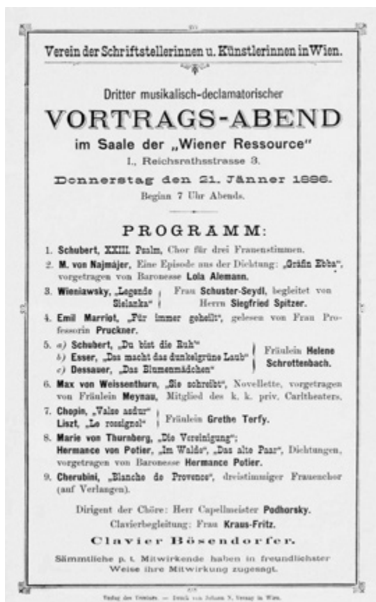
Abbildung 5: Einladung zur Publikumssoiree, 1886