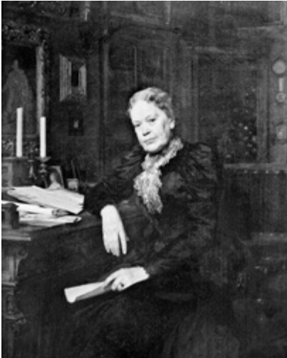
Abbildung 2: Marie von Ebner-Eschenbach